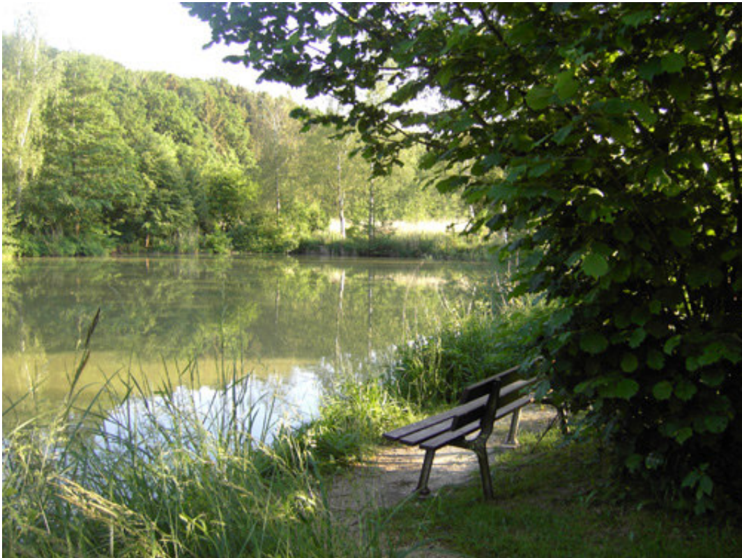
Der See hinter dem Haus