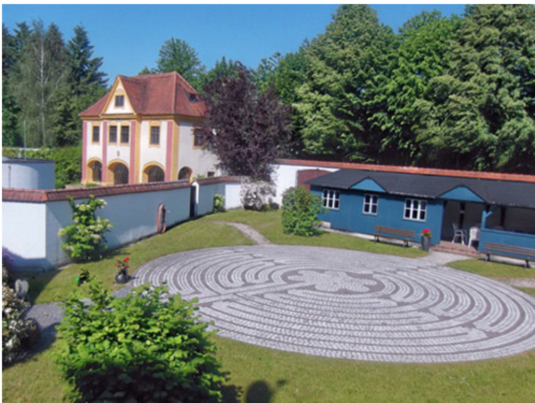
Das Chartre Labyrinth im Klostergarten